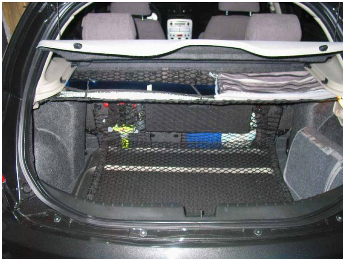
reti retro schienale e rete del pack confort: